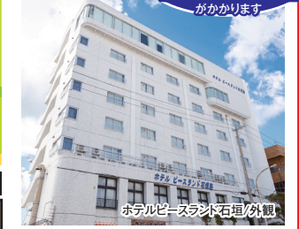
ホテルピースランド石垣/外観